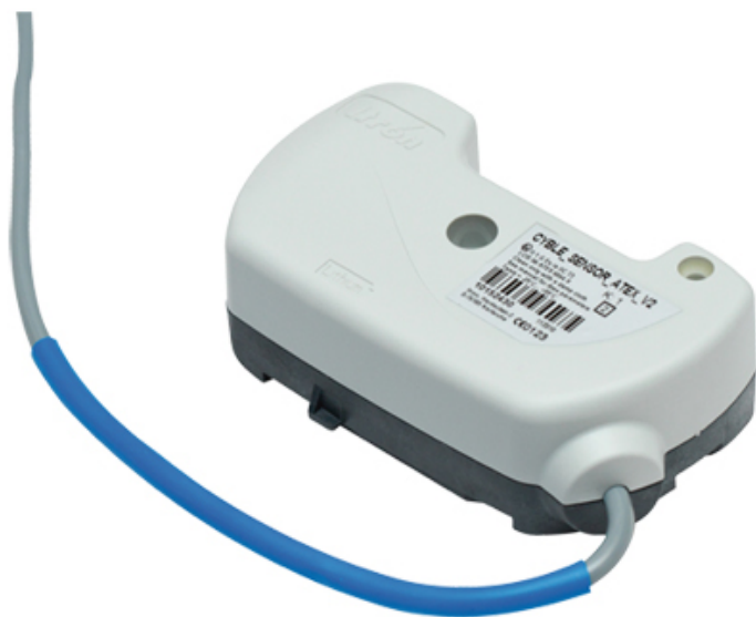
Рис. 2.1. Датчик Cyble_Sensor_ATEX V2