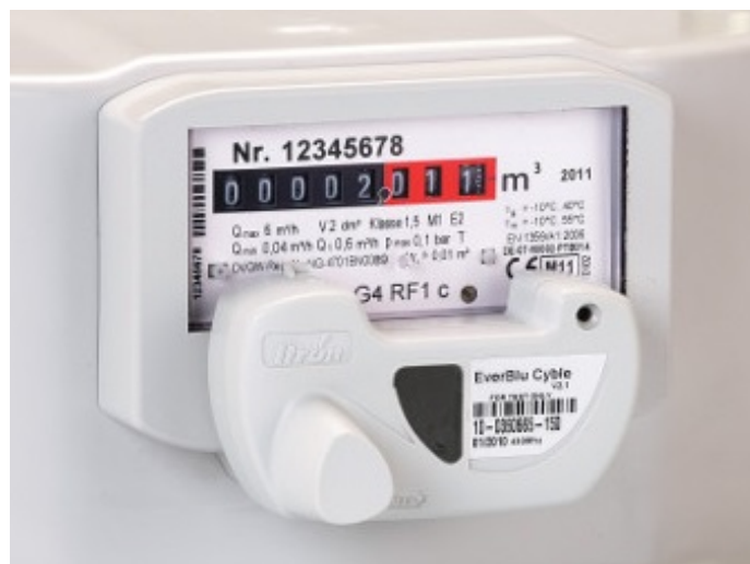
Рис. 2.4. Модуль EverBlu Cyble, смонтированный на отсчетное устройство счетчика