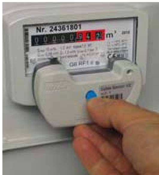
Рис. 2.2. Датчик Cyble_Sensor_ATEX V2, смонтированный на отсчетное устройство счетчика