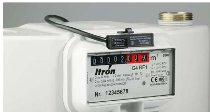
Рис. 2.6. НЧ датчик импульсов, смонтированный в гнездо отсчетного устройства счетчика