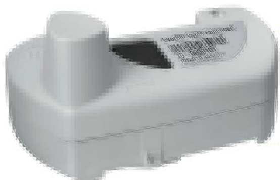
Рис. 2.3. Модуль EverBlu Cyble